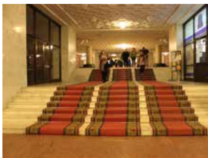
Лестница в шестом корпусе — одна из непреодолимых преград для колясочника

первокурснику с ограниченными возможностями