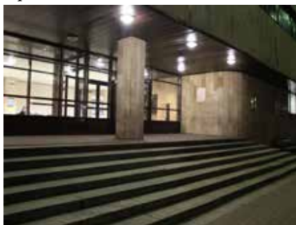
Вход во второй корпус ещё недавно выглядел так. Недавно здесь появился пандус. Идут испытания...