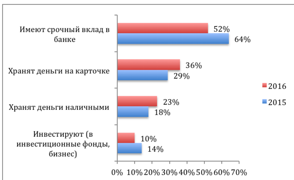
Рисунок 1. Способы хранения сбережений (в процентах от общего числа тех, кто имеет сбережения)

В 2016 году произошло существенное падение объема сбережений населения: число людей, которые имеют сбережения, сократилось на треть. В 2015 году 55% опрошенных говорили о том, что у них есть сбережения; в 2016 году о наличии сбережений сказали только 40% опрошенных (чаще всего речь шла о сумме в размере нескольких месячных доходов). Кроме того, изменились стратегии хранения сбережений (рисунок 1). Существенно сократилось число людей, имеющих срочный вклад в банке. Снизилось также количество людей, которые приобретают ценные бумаги. На данный момент те, кто имеет сбережения, предпочитают хранить их в наиболее ликвидной форме: наличными или на карточке.