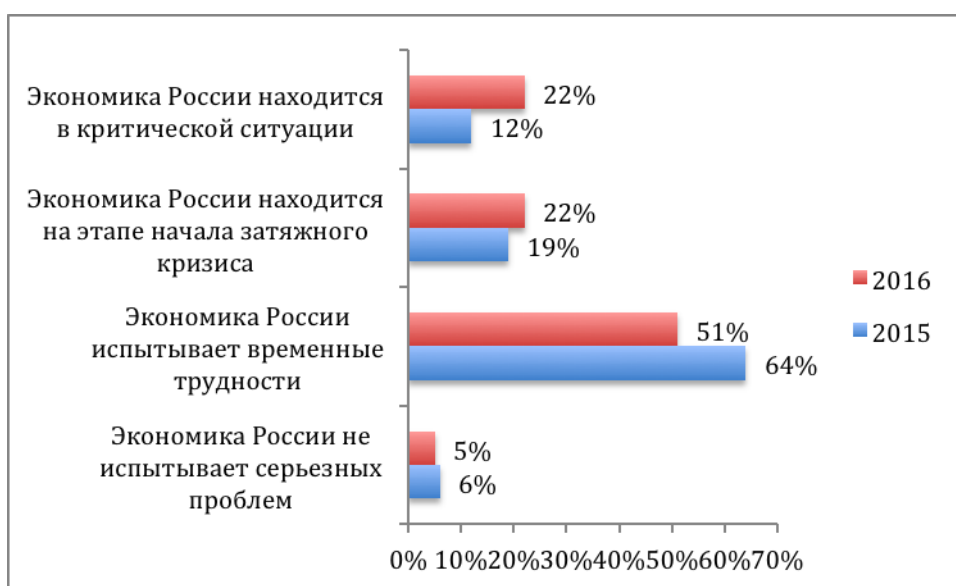
Рисунок 2. Оценка населением состояния российской экономики

Снижение объема сбережений может быть объяснено изменением экономических ожиданий. В 2015 году, несмотря на негативную оценку текущего положения в экономике, подавляющее большинство населения (64%) говорило о том, что экономика России испытывает временные трудности, и в дальнейшем ситуация улучшится. Число людей, которые считают, что экономические трудности – временное явление, упало за год почти на 30%. Количество тех, кто считает, что экономика России находится в критической ситуации или на этапе начала затяжного кризиса, наоборот, выросло по сравнению с прошлым годом (рисунок 2).