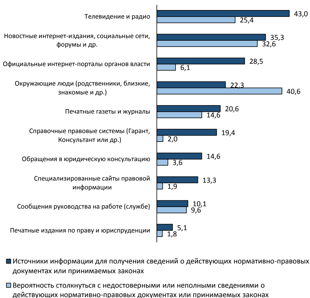
Рисунок 3 – Характеристика источников правовой информации (в %)

В исследовании также были проанализированы основные источники получения гражданами правовой информации (рисунок 3).