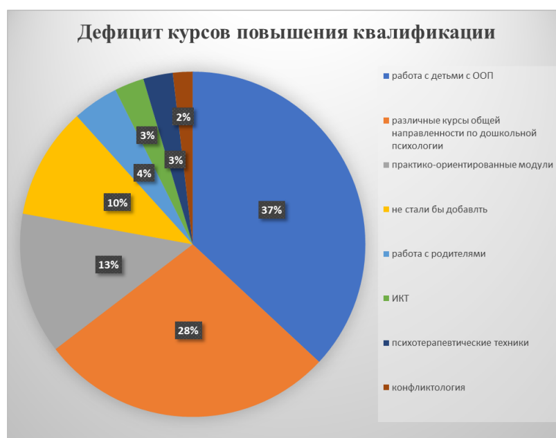
Рисунок 6 – Распределение дефицита курсов повышения квалификации среди педагогов-психологов

На муниципальном уровне помощь может быть оказана, например, специалистами консультационных центров (служб) по оказанию психолого-педагогической, методической и информационной поддержки родителям детей дошкольного возраста. На базе этих центров может быть организована, в том числе, работа и со специалистами дошкольных образовательных организаций, испытывающих организационный стресс или желающих получить поддержку в его профилактике.