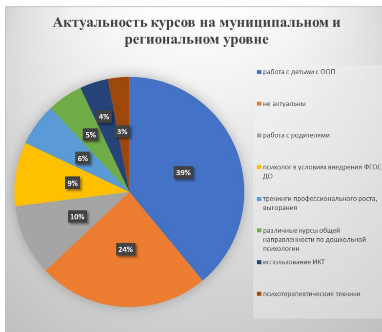
Рисунок 5 – Распределение курсов повышения квалификации по их актуальности для психологов на муниципальном и региональном уровне