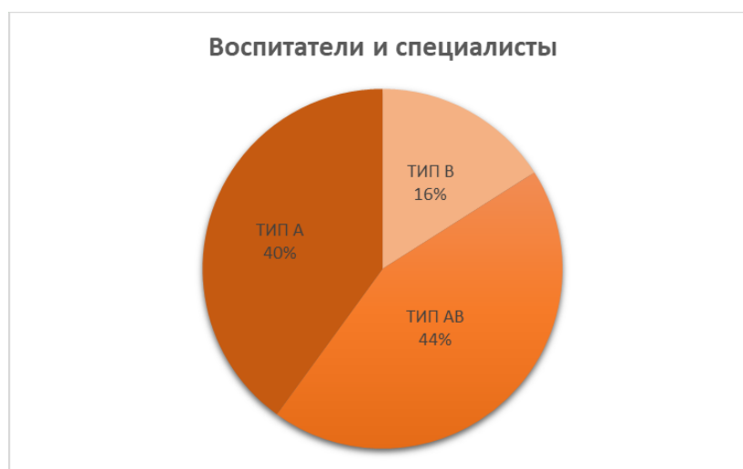
Рисунок 1 - Процентное соотношение типов поведения в третьей группе – воспитателей и специалистов.

Во-первых, проанализировав результаты по группам, можно с уверенностью сказать, что, к сожалению, наименьшая часть участников опроса обладает высокой стрессоустойчивостью. И в третьей группе (воспитателей и специалистов) эта ситуация наиболее отчетливо выражена (Рисунок 1).