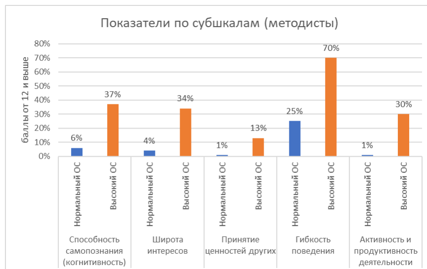
Рисунок 3 - Показатели по субшкалам во второй группе (методисты) в процентном соотношении по подгруппам лиц с высоким и с нормальным индексом ОС

В третьей группе участников опроса (воспитатели и специалисты) разница в показателях по шкале «Гибкость поведения» немного меньше, чем в первых двух группах, но также занимает первое место по значимости. Показатели по шкалам «Широта интересов» и «Активность и продуктивность деятельности» приблизительно равнозначны (Рисунок 4).