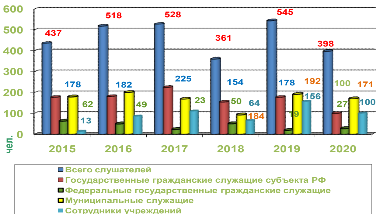
Рисунок 3. Контингент слушателей курсов повышения квалификации.

Контингент слушателей курсов повышения квалификации в динамике за последние пять лет представлен на рисунке 3.