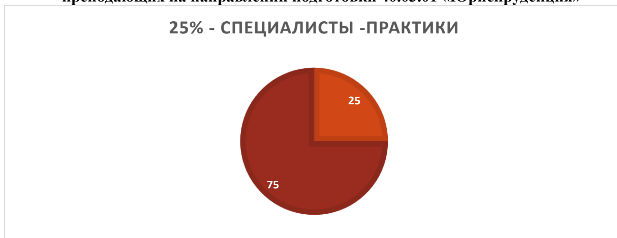
Диаграмма 1. Доля специалистов-практиков в общем количестве преподавателей, преподающих на направлении подготовки 40.03.01 «Юриспруденция»

В учебном процессе при реализации направления подготовки 40.03.01 «Юриспруденция» задействованы специалисты – практики различных профессиональных юридических направлений, таких как адвокатура, правоохранительные органы, судебные органы, криминалистика, третейское разбирательство. Доля специалистов - практиков в общем количестве преподавателей составляет 25%.