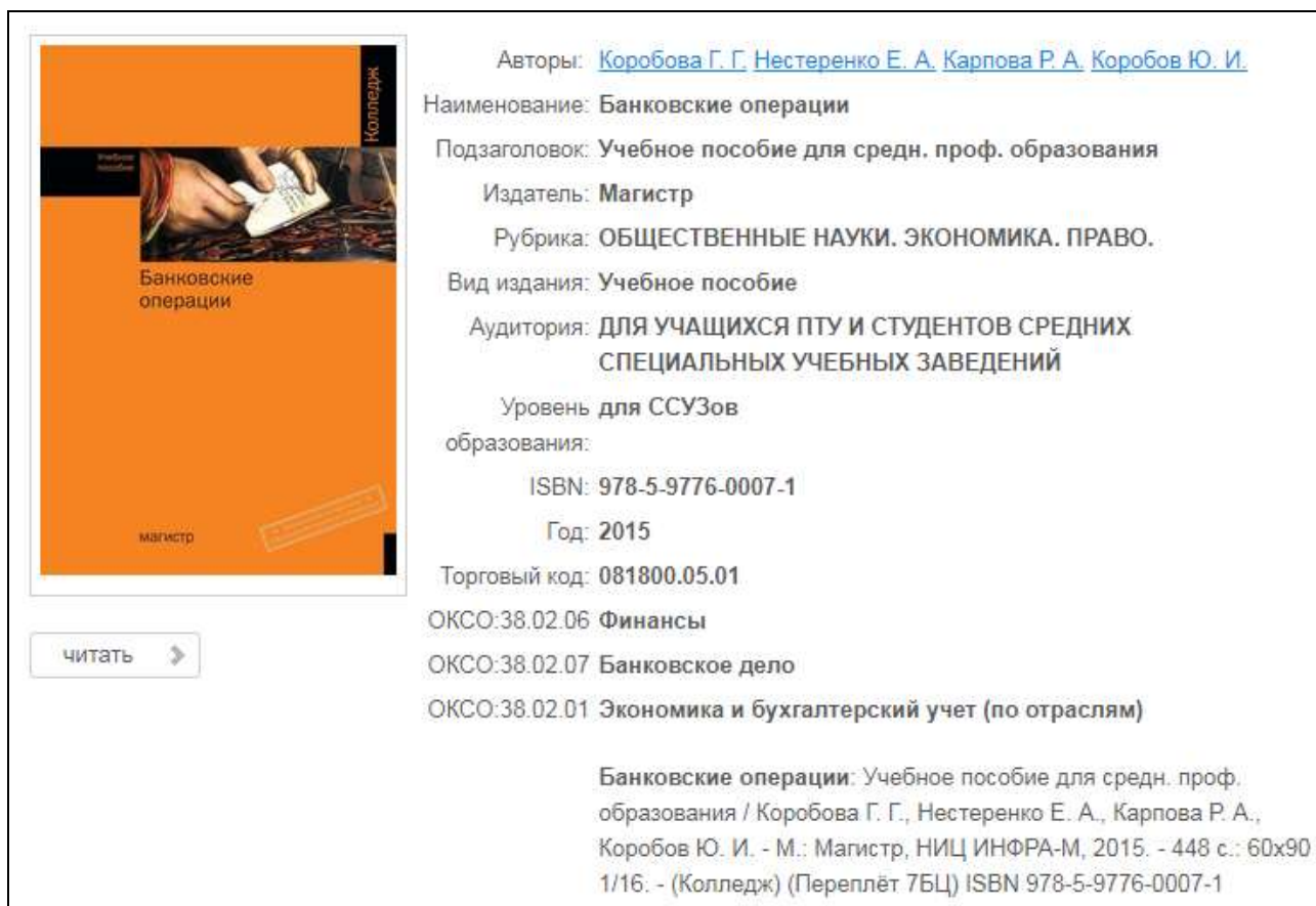
Рисунок 1 – Выходные данные об учебном пособии на сайте ZNANIUM.COM

На базе представленных на рисунке 1 данных можно делать следующую запись в списке использованных источников: Банковские операции [Электронный ресурс]: Учебное пособие для средн. проф. образования / Коробова Г.Г., Нестеренко Е.А., Карпова Р.А., Коробов Ю.И. - М.: Магистр, НИЦ ИНФРА-М, 2015. - 448 с. – Режим доступа: http://znanium.com/catalog.php?item=bookinfo&book=493636 (Дата обращения 22.10.2017).