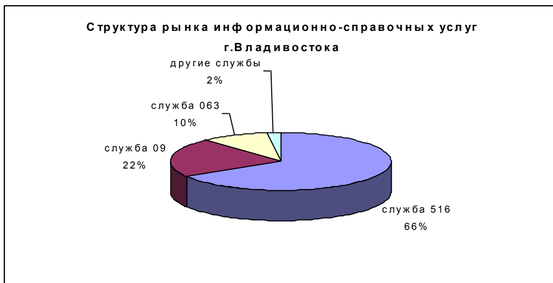
Рис.2 Рынок информационно-справочных услуг г. Владивостока (по данным МГ «Мегалинк», 2005 г.)

Результаты исследования показали, что «Служба 516» на рынке информационно-справочных услуг является безусловным лидером, количество клиентов которой в три раза превышает количество клиентов «Службы 09» и в 6,6 раза – клиентов «Службы 063». Однако положение лидера может легко быть утеряно, если не подкрепляется необходимой инновационной активностью, вторжением на новые рынки. Именно эта стратегическая задача и легла в основу проекта организации call-центра.