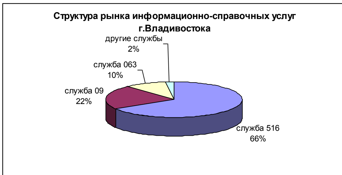
Рис.2 Рынок информационно-справочных услуг г. Владивостока (по данным МГ «Мегалинк», 2005 г.)

Результаты исследования показали, что «Служба 516» на рынке информационно- справочных услуг является безусловным лидером, количество клиентов которой в три раза превышает количество клиентов «Службы 09» и в 6,6 раза – клиентов «Службы 063». Однако положение лидера может легко быть утеряно, если не подкрепляется необходимой инновационной активностью, вторжением на новые рынки. Именно эта стратегическая задача и легла в основу проекта организации call-центра.