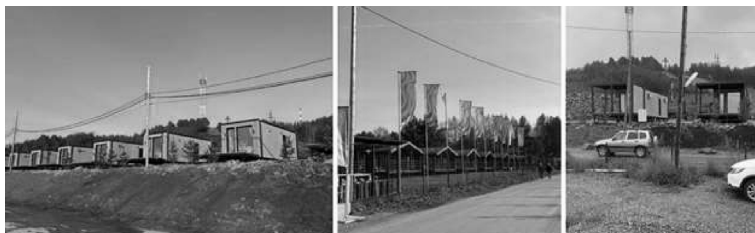
Рис. 3. Пример несформированной пешеходной среды в экодеревне