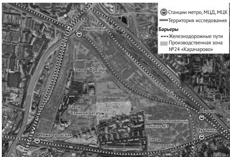
Рис. 1. Расположение территории исследования