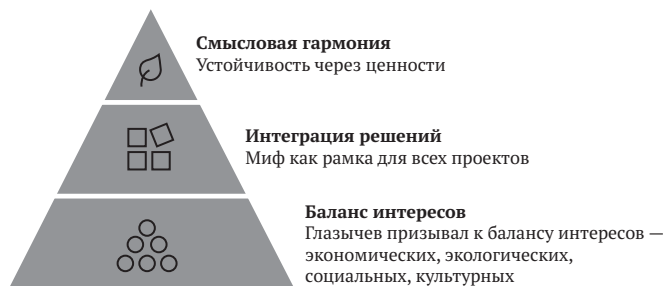
Рис. 3. Системность и устойчивость решений

Эффективный миф = = Системность и устойчивость решений