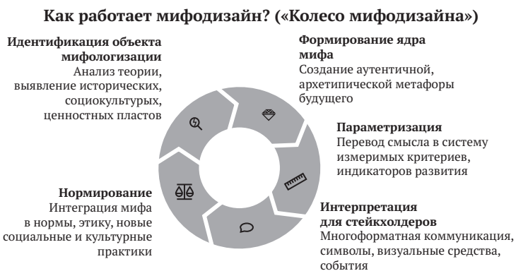
Рис. 1. Мифодизайн: ключевые принципы

2-й этап. Формирование ядра мифа . На втором этапе создается базовый образ будущей территории. Следуя заветам Глазычева о поиске «гениуса места», мы кристаллизуем базовую метафору будущего, резонирующую с историей террито-