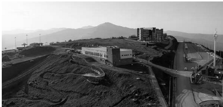
Рис. 2. Пример курорта на активном рельефе со скрытыми горными ручьями