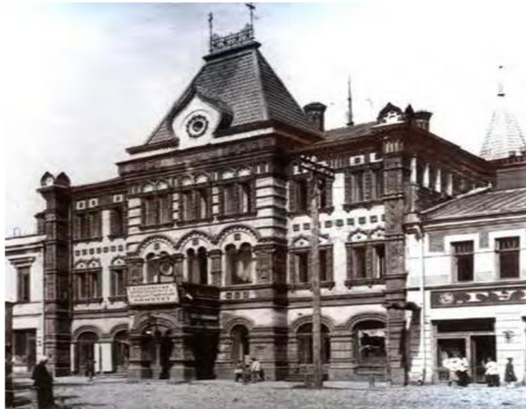
Здание банка. Архитектор С.К. Родионов. 1897 – 1900 гг. Ул. Гостиная, 6; ул. Правый берег р. Орлика, 22-24. Фото начала XX в.