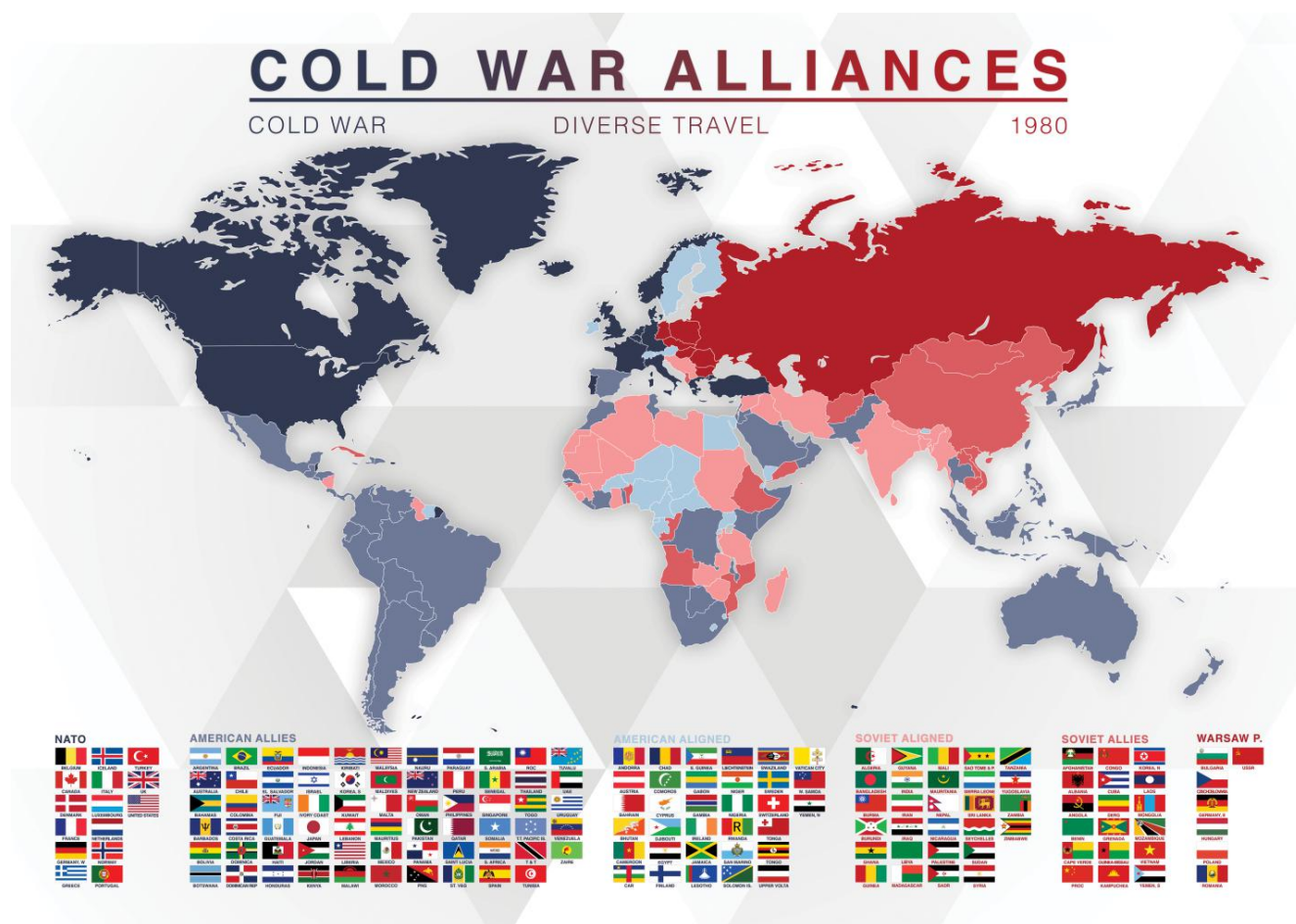
Рис. 2.1. Союзники СССР в 1980-х гг., поддерживавшие страну и в процессе международного спортивного взаимодействия.

В нормативно-правовом контексте значимость спортивной составляющей в государственной политике советского государства утвердилось достаточно поздно. Так, свое официальное утверждение спортивная политика получила только в 1988 году, когда было принято постановление «О совершенствовании управления футболом, другими игровыми видами спорта и дополнительных мерах по содержанию команд и спортсменов по основным видам спорта» 96 . Оно отражало централизацию управления спортивной сферой, обеспечивало гарантии прав спортсменов и реформирование в целом спортивной сферы.