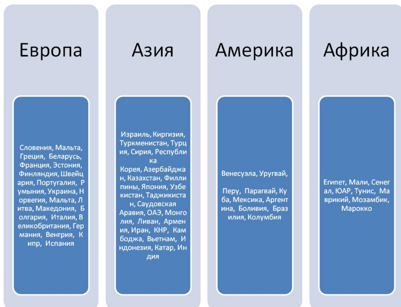
Рис. 2.2. Страны, с которыми РФ имеет подписанные меморандумы, соглашения, программы сотрудничества в сфере спорта.

обозначенных государств. Однако оно предполагает возможность диалога и формирования многоканального воздействия посредством проведения совместных спортивных мероприятий, обсуждения вопросов и выработки решений по спортивным вопросам и прочие направления гуманитарной дипломатии, развивающейся в современной России.